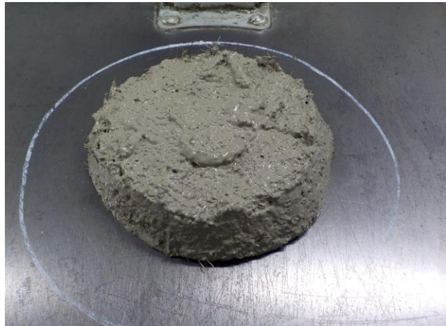
リペアメントFEのフレッシュ性状